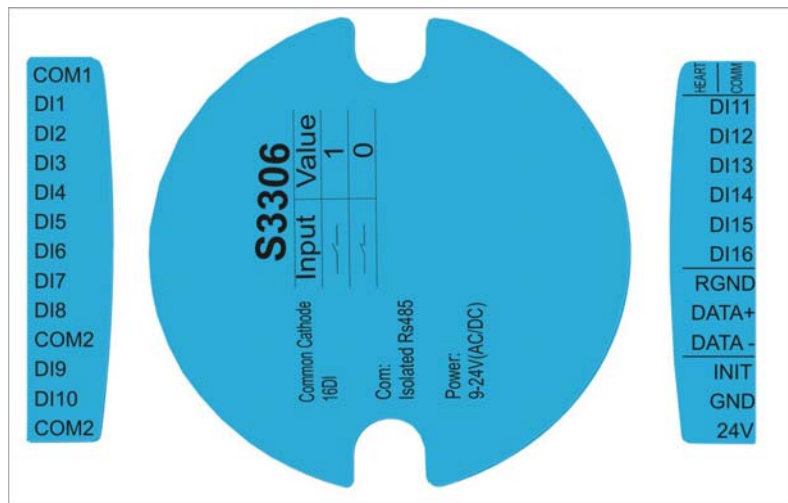
图 2 整体端子定义框图