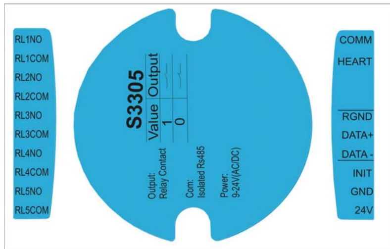
图 2 整体端子定义框图